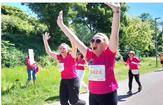
Begeisterung und Durchhaltevermögen zeigten die Mitarbeitenden bei der Badischen Meile.

131 Mitarbeitende gingen am 11.05. bei dem Karlsruher Traditionslauf Badische Meile an den Start und meisterten 8,88889 Kilometer in den Kategorien Lauf, Walking und Nordic Walking – Eine starke Leistung!