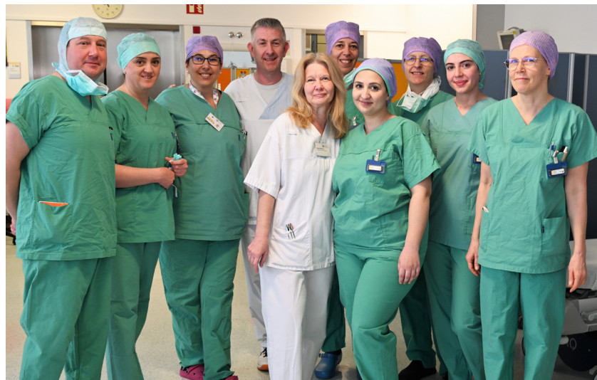
Das Team des ViDia AOZ Karlsruhe begleitet die Patientinnen und Patienten am Tag der OP.

Ob eine ambulante OP im Einzelfall in Frage kommt, entscheidet das fachärztliche Personal. Die erste Kontaktaufnahme erfolgt für alle Patientinnen und Patienten in der jeweiligen Fachambulanz.