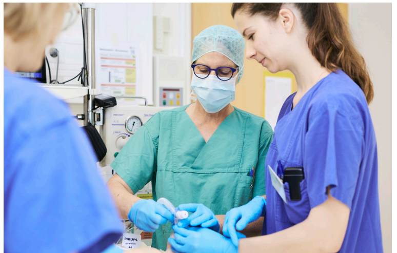
„Soll ich tatsächlich Handschuhe anziehen?“ – „Ja, alles wird simuliert.“ Im Training wird abgelaufenes Material verwendet.