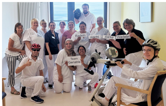
Das Team der Geriatrie nahm hochmotiviert an der Aktion STADTRADELN teil.

Vom 29.06. bis 19.07. fand die Aktion STADTRADELN in Karlsruhe statt. Die ViDia Kliniken stellten mit 153 Personen eines der größten Teams. Mit 3.867 Fahrten und 42.663 km erreichten sie in der Gesamtwertung den 5. Platz und in der Kategorie „Gesundheitswesen“ sogar den 1. Platz. Herzlichen Glückwunsch!