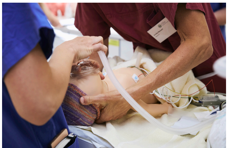
Beim Betreten des Kreißsaals wird aus den einzelnen Mitarbeitenden sofort ein Team. Das gemeinsame Ziel ist die Sicherheit der Neugeborenen und ihrer Mütter.