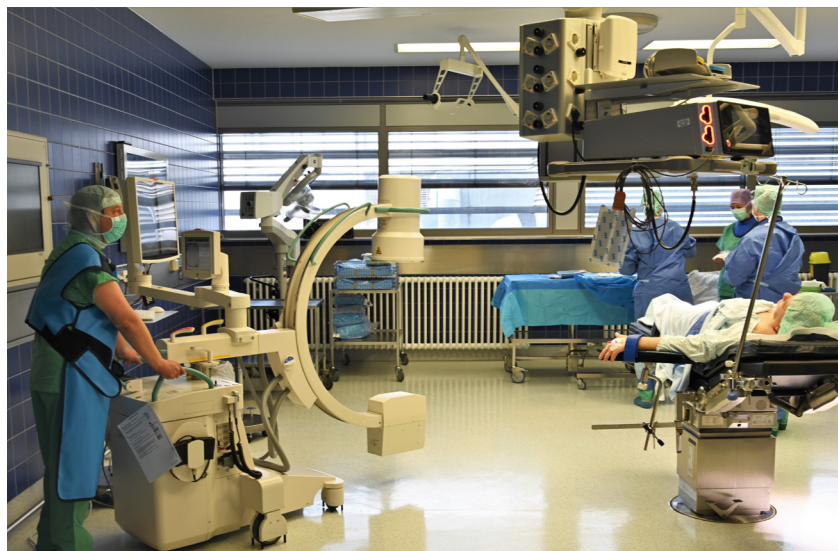
Die Strukturen und Abläufe im ViDia AOZ Karlsruhe sind auf die ambulanten Eingriffe abgestimmt und für diese optimiert.