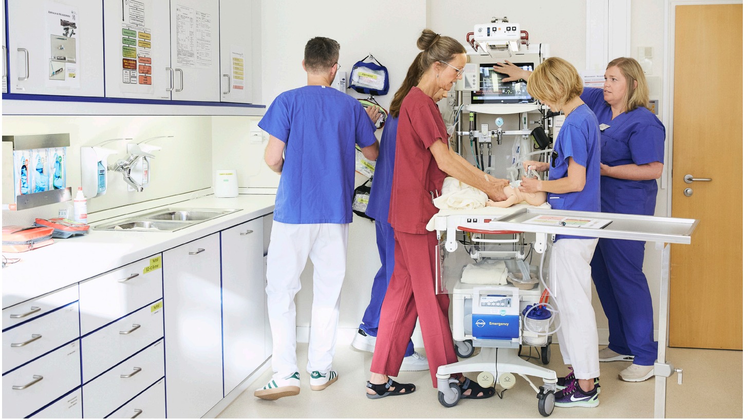
Alle konzentrieren sich ganz auf ihre Aufgaben und verlassen sich auf ihre Kolleginnen und Kollegen aus den anderen Fachbereichen.

Abläufe optimieren. Wertvoll sind zudem die positiven Auswirkungen auf die einzelnen Teilnehmenden. Diese gewinnen ein höheres Sicherheitsgefühl im Umgang mit Herausforderungen. Das stärkt ihr Selbstvertrauen und ihr Wohlbefinden bei der Arbeit.