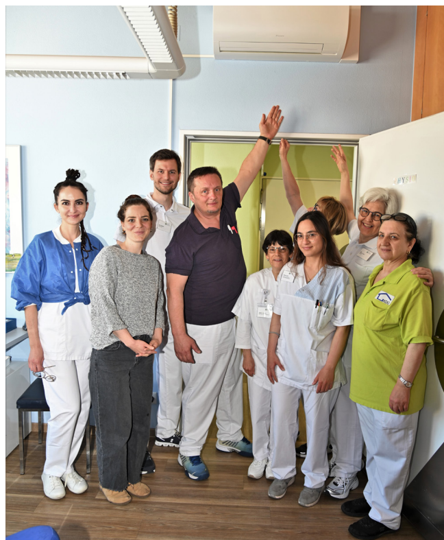
Das Team der Palliativstation freut sich über diese wertvolle Spende!